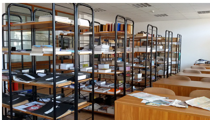
2.000000 В Читални зали

Заемане на учебна, монографична, специализирана и художествена литература за дома. В началото на всеки семестър студентите могат да получат учебници и учебни помагала по изучаваните дисциплини за срок от един семестър и възможност за презаписване за още един.